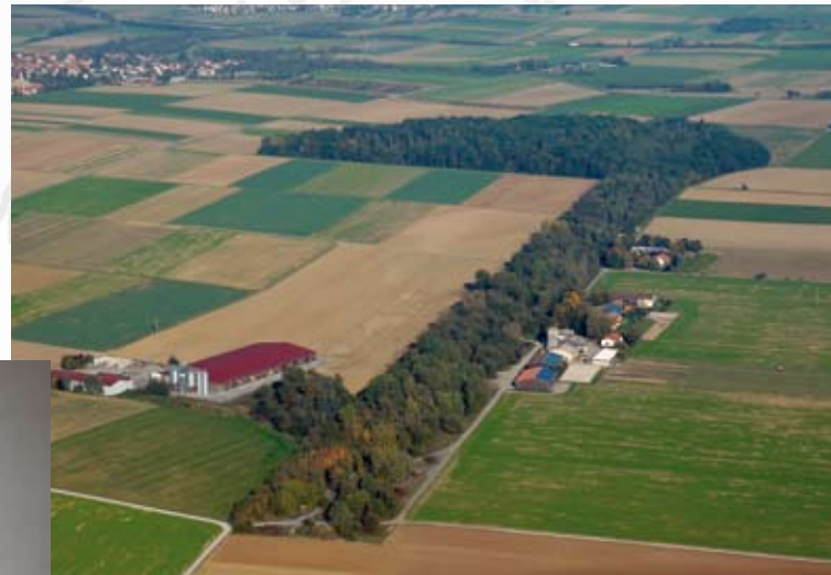
Bewaldete Startbahn, Luftbild 2005, Gabriel Holom

Die KZ-Gedenkstätte Hailfingen/Tailfingen wurde von der Stadt Rottenburg am Neckar und der Gemeinde Gäufelden geschaffen. Sie soll an das Geschehen auf dem Gelände des ehemaligen Nachtjägerflugplatzes erinnern. Mit dem auf der früheren Landebahn stehenden Mahnmal des Ellwanger Künstlers Rudolf Kurz wird der 600 KZ-Insassen gedacht.